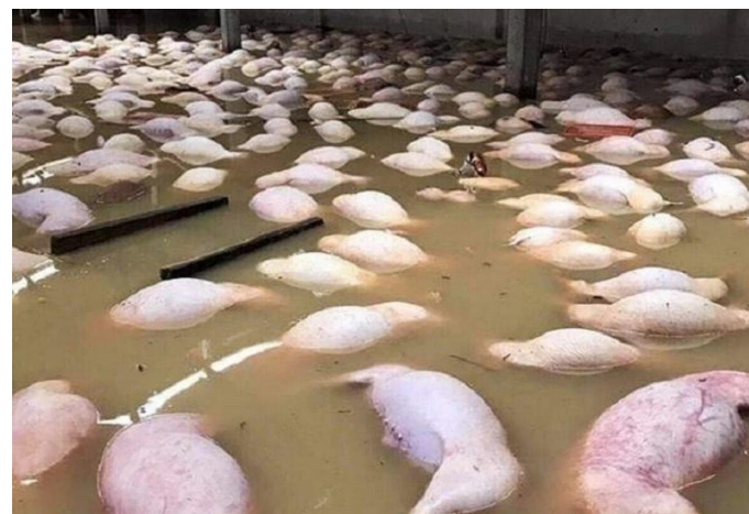
Alluvione Romagna, oltre 600 maiali morti annegati: "li tiriamo fuori da due giorni, non finiscono più"

I suini annegati durante una piena, dovranno essere smaltiti secondo le direttive del Servizio Veterinario dell'ASL interessata. In genere, è previsto l'incenerimento.