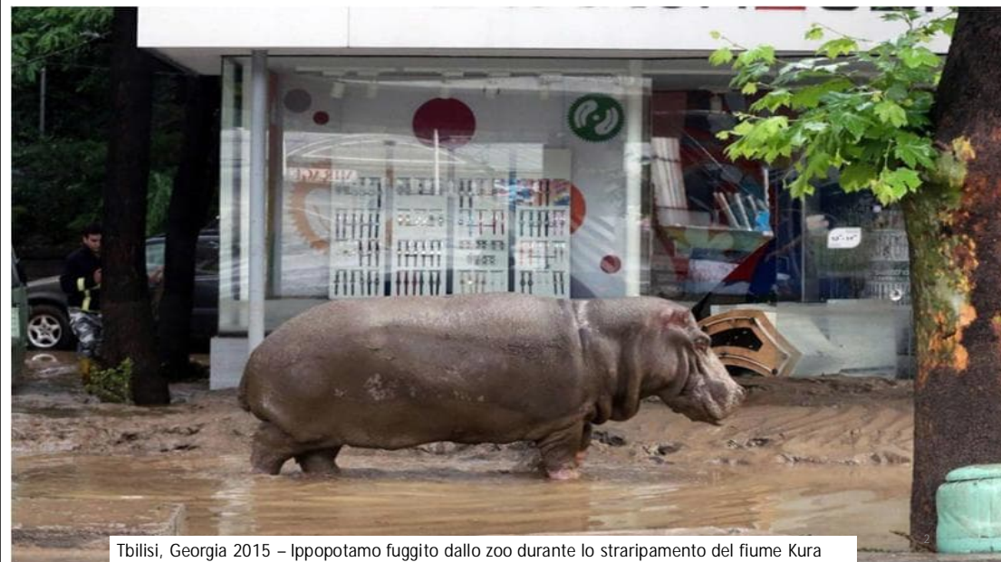
Tbilisi, Georgia 2015 – Ippopotamo fuggito dallo zoo durante lo straripamento del fiume Kura