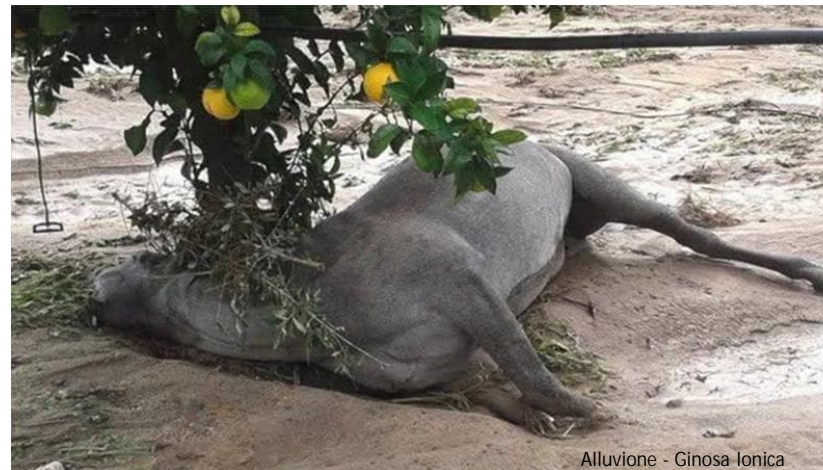
Alluvione - Ginosa Ionica

I bovini deceduti durante una alluvione, a causa del pericolo di diffusione della BSE (morbo della mucca pazza) non potranno essere riutilizzati per la preparazione di mangimi ma dovranno essere smaltiti in un inceneritore.