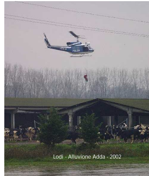
Lodi - Alluvione Adda - 2002

In caso di isolamento di aziende agricole con animali a causa di una esondazione è necessario prevedere gli interventi per fornire mangime o foraggio. Nella foto: intervento con un elicottero per l'alimentazione dei bovini in un allevamento in provincia di Lodi circondato da acque di piena