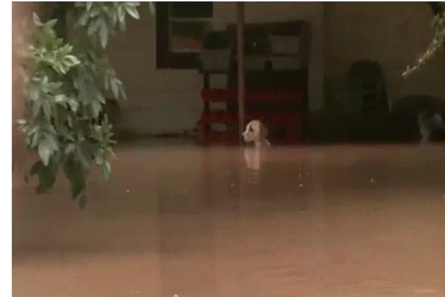
Cane lasciato alla catena durante una alluvione

Durante l'evacuazione dell'abitazione, se non possiamo portarli con noi, è necessario liberare gli animali legati alla catena o chiusi nei recinti.